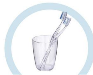
ТУАЛЕТНЫЕ ПРИНАДЛЕЖНОСТИ (ЗУБНЫЕ ЩЕТКИ, РАСЧЕСКИ И ПР.)