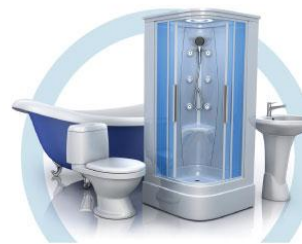
ТУАЛЕТ (УНИТАЗ, ВАННА, ДУШЕВАЯ КАБИНА, БИДЕ)