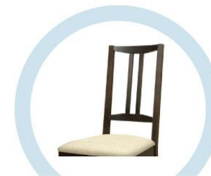
СПИНКИ СТУЛЬЕВ, НЕ ОБИТЫЕ ТКАНЬЮ И МЯГКИМ ПОРИСТЫМ МАТЕРИАЛОМ