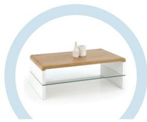
ЖУРНАЛЬНЫЕ СТОЛИКИ И ПРОЧИЕ ЖЕСТКИЕ ПОВЕРХНОСТИ