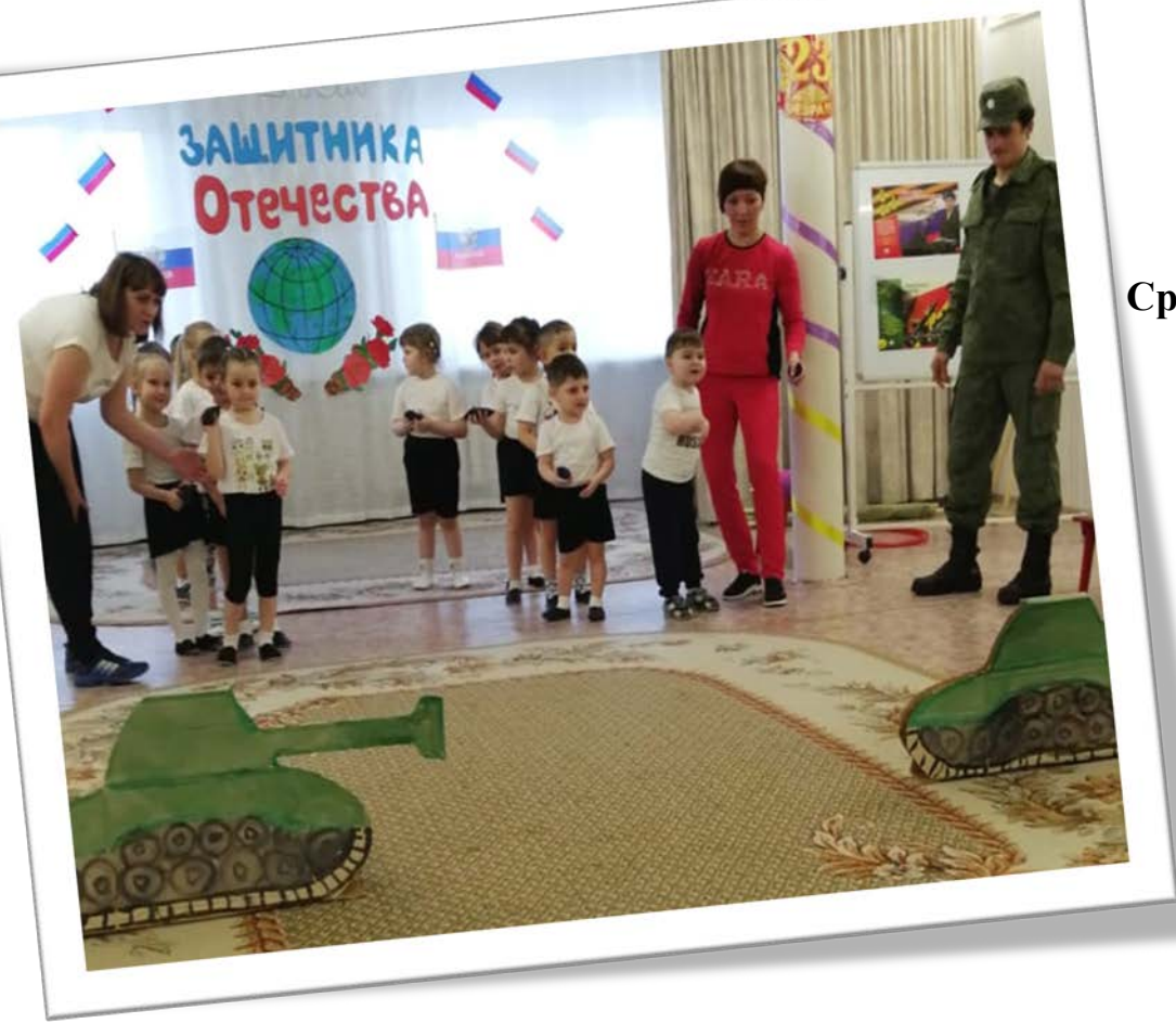
Средняя группа «Сказка»