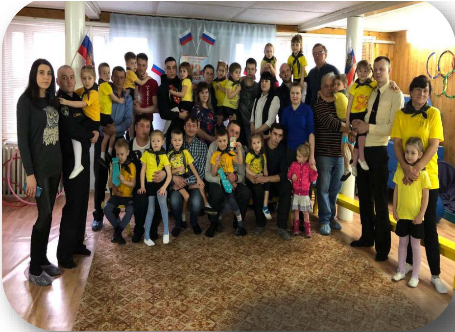
Средняя группа «Солнышко»