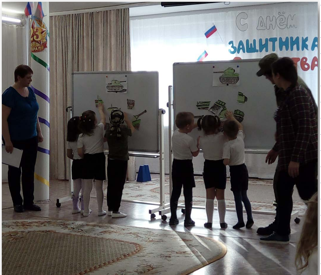
Старшая группа «Ромашк»