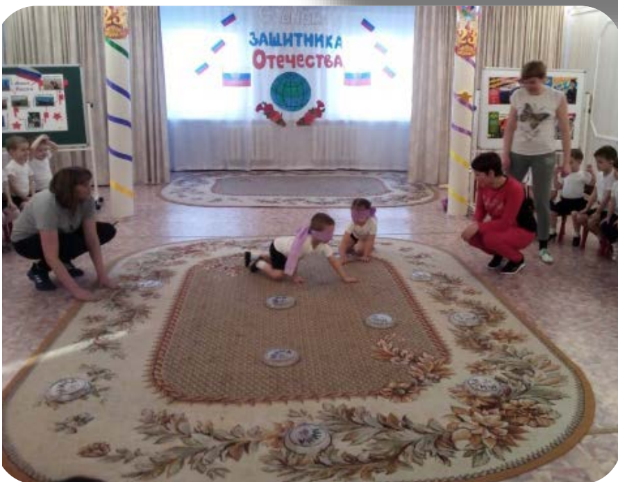
Средняя группа «Белочка»