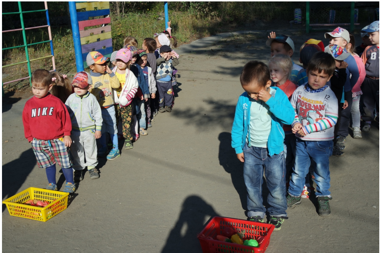
гр. «Радуга» и гр. «Аистенок»